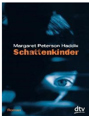
Haddix, Margaret: Schattenkinder

Für Steven ist sein Schlagzeug die wichtigste Sache der Welt. Doch das ändert sich, als sein kleiner Bruder an Leukämie erkrankt.