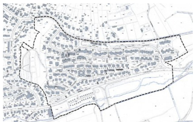
Lageplan Stadtbauamt/Stadtplanung vom 12.11.2014 mit Abgrenzung des Geltungsbereiches

Der in der Anlage beigefügte Lageplan des Stadtbauamtes/Stadtplanung vom 12.11.2014 mit Abgrenzung des