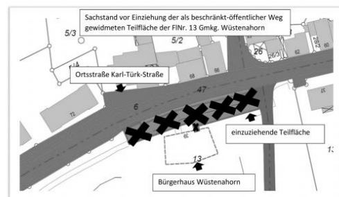
Einziehung der als beschränkt-öffentlicher Weg gewidmeten Teilfläche der FlNr. 13 Gmkg. Wüstenahorn, Karl-Türk-Straße