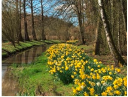
Narzissenblüte im Frühjahr

Der WildPark Schloss Tambach ist die wunderschöne und einmalige Kombination von Schloss, englischem Schlosspark und Tierwelt. Das Barockschloss, von Mönchen Ende des 17. Jhd. erbaut, und der Park befinden sich seit der Säkularisation im Privatbesitz der Grafen zu Ortenburg. Die prachtvolle Baumkulisse mit altem, im Sommer Schatten spendendem Baumbestand, viele Sichtachsen, in den Park großzügig eingebettete Tiergehege und Volieren, Bachläufe, Teiche, Mühlrad und viele Blumenarten machen den 50 ha großen Park zu einem einzigartigen und erlebnisreichen Ausflugsziel für alle Altersklassen. Im Frühjahr erblühen japanische Kirschbäume, gefolgt von weit über 35.000 Narzissen. Später folgen, je nach Jahreszeit, Rhododendren, Azaleen, Hortensien, Fritillaria, Rosen, Lavendel, Hosta u.v.m. Ein einzigartiges Erlebnis ist im Herbst der Park mit prachtvoller Herbstfärbung und Hirschbrunft. Unsere klassizistische Schlosskirche im Schloss kann vom Schlosshof aus besichtigt werden. Unser Biergarten, direkt am Hirschgehege mit Blick auf Rot-, Dam- und Sikawild gelegen, bietet unseren Gästen u. a. verschiedene Wildspezialitäten.