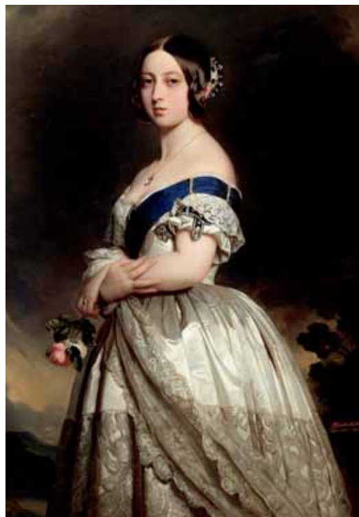
Öl auf Leinwand im Herzoglichen Kunstbesitz auf Schloss Callenberg: Victoria Königin von Großbritannien und Irland – Kusine und Ehefrau – 1842 in einer Darstellung von Franz Xaver Winterhalter (1805 – 1873)

November 1840 wird das erste Kind, Prinzessin Vicky, geboren, am 9. November 1841 feiert man die Geburt des Thronfolgers, Edward VII.. Es folgen Alice, Alfred, Helene, Louise, Arthur, Leopold und Beatrice. Eigentlich ist angedacht, daß Albert sich um die Erziehung der Kinder kümmert, was er auch gerne übernimmt. Darüber hinaus widmet sich Albert der Kunst, der Literatur, den