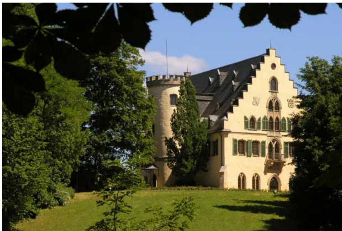
Nach Schloss Rosenau, dem Haus seiner Geburt und Jugend, kehrte Albert immer wieder zurück. Auch Königin Victoria schwärmte viel von diesem zauberhaften Ort vor den Toren der Stadt.

Daß ein junger Adliger im 19. Jahrhundert vielerlei Möglichkeiten hat, eine gute Bildung zu erhalten, ist nichts Besonderes. Doch Albert erweist sich als ein sehr neugieriger Mensch, der alles in sich aufzusaugen scheint, das sich ihm bietet. So ist es insbesondere seine universale Bildung, die es dem