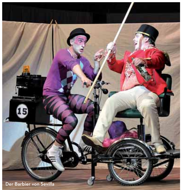
Der Barbier von Sevilla

Landestheater Coburg · Schlossplatz 6 · 96450 Coburg