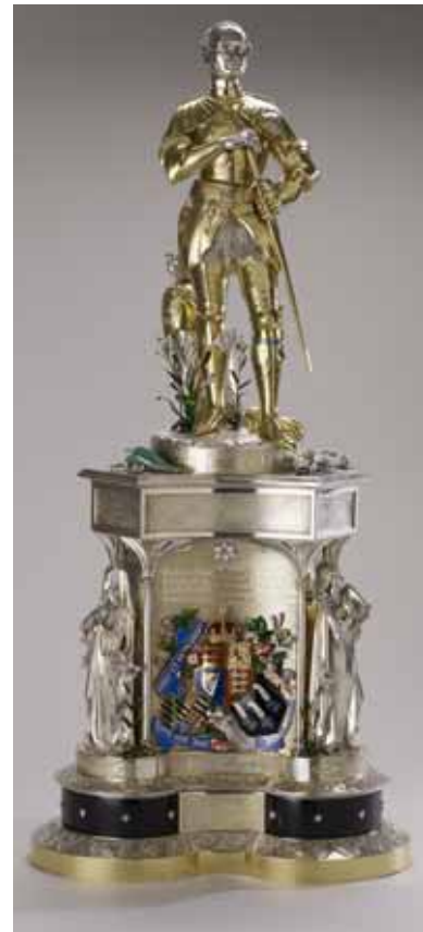
In Ihrer Ausstellung "Prinz Albert – ein Bild von einem Mann" zeigen die Kunstsamm-lungen der Veste Coburg außerge-wöhnliche Exponate der Royal Collection, wie diese Statuette zu Alberts Gedenken

den Hofgarten gegenüber seinem Bruder Ernst bemerkt haben, daß er dies alles wohl zum letzten Mal sehen werde. Als er am 12. Dezember 1861 überraschend im Alter von 42 Jahren stirbt – offiziell an Typhus, heute nimmt man an er hatte Krebs – ist Königin Victoria hilf- und ratlos. Sie lebt umfängen von ihrer Trauer und läßt zu Alberts Gedenken zahlreiche Denkmäler in der ganzen Welt anfer-tigen. 1865 reist sie persönlich und mit ihren neun Kindern nach Coburg um hier das Albert-Denkmal auf dem Marktplatz zu enthüllen. Auf dem mächtigen Sockel im Ornat eines Ritters des Hosenbandordens, dem höchsten Orden des Königsreiches, hält Prinz Albert in der rechten Hand den Bauplan für den Glas-palast der Weltausstellung. Geduldig schaut er herab, auf seine Coburger und sein Alter ego, den Stadtführer, der noch viel mehr über ihn zu erzählen weiß. ■