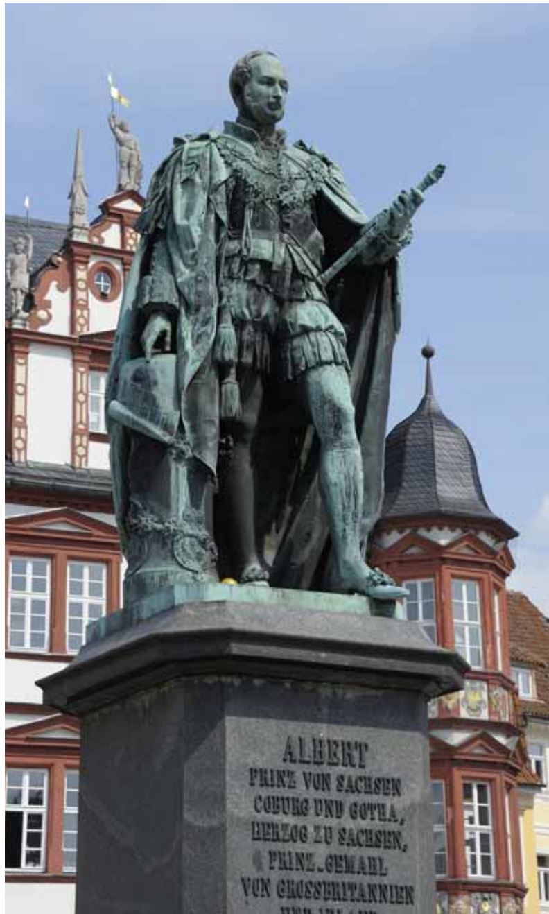
Prinz Alberts Denkmal ist heute ein markanter Treffpunkt auf dem lebhaften Coburger Marktplatz

Dabei beginnen die Spuren des berühmten Adligen eigentlich vor den Toren der Stadt. Denn nicht in Coburg selbst, sondern auf Schloß Rosenau, der Sommerresidenz der Herzöge, wird Albert, am 26. August 1819 geboren. Den größten Teil seiner Kindheit lebt er hier im roman-